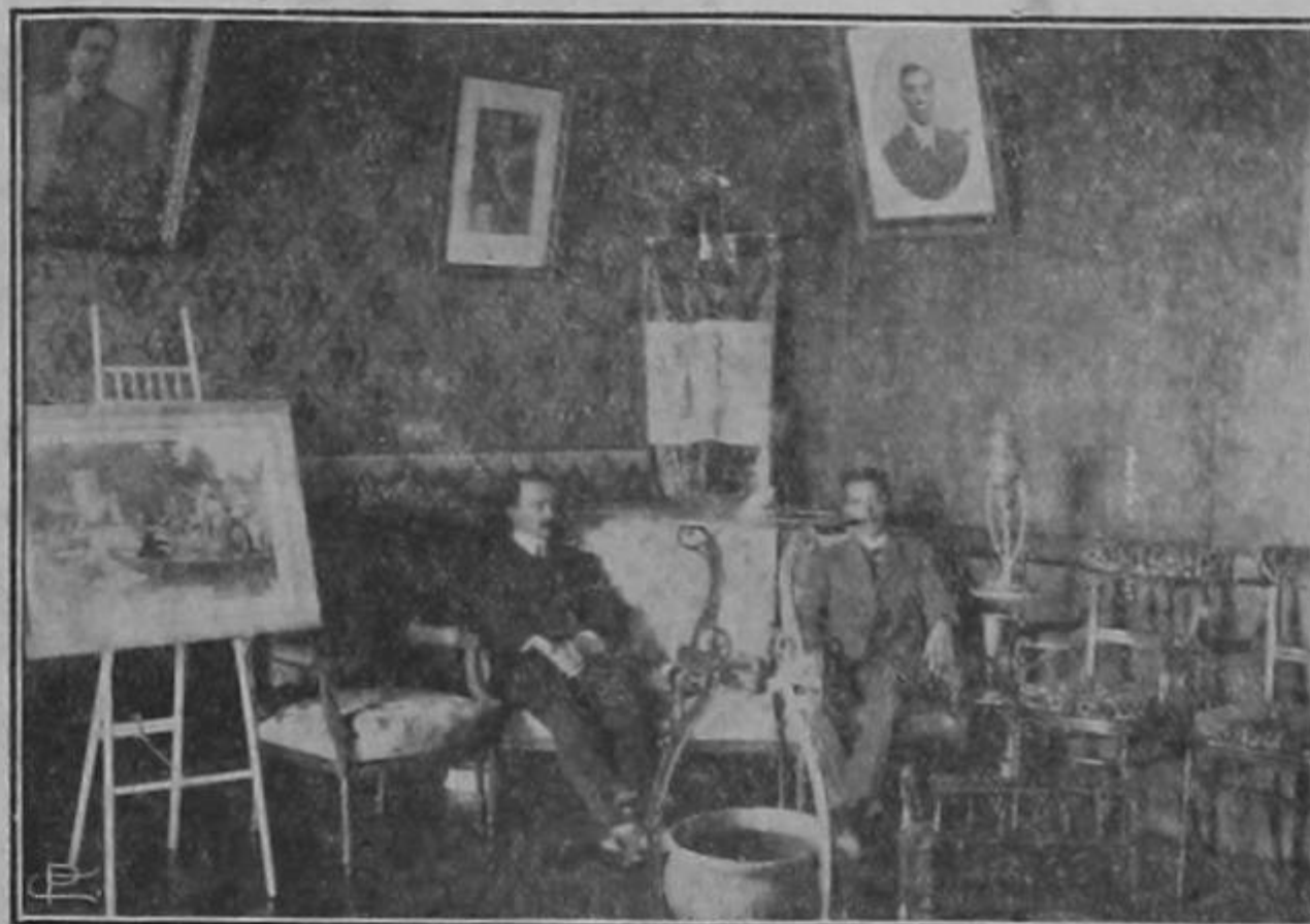
Salones del Club